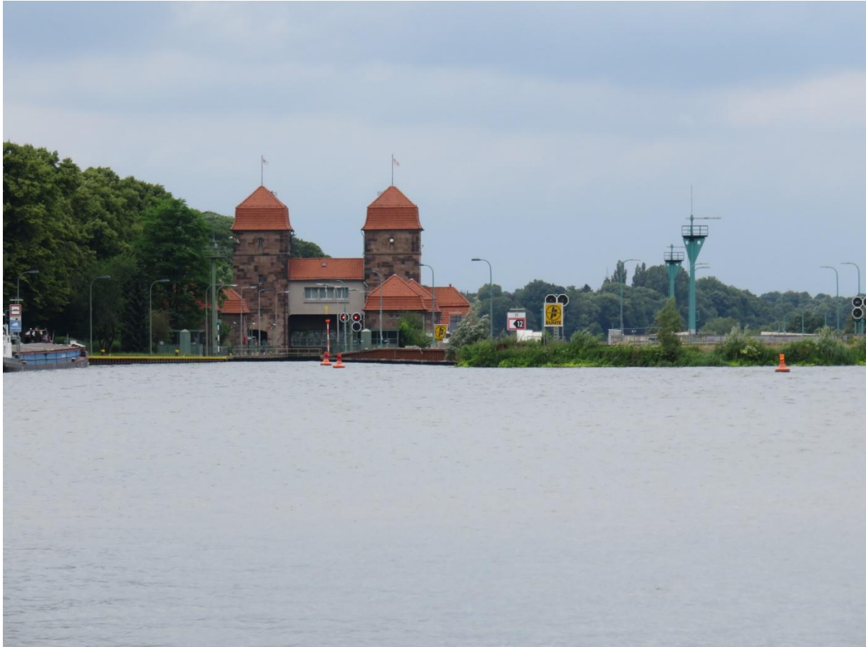
De Schachtsluis van Minden