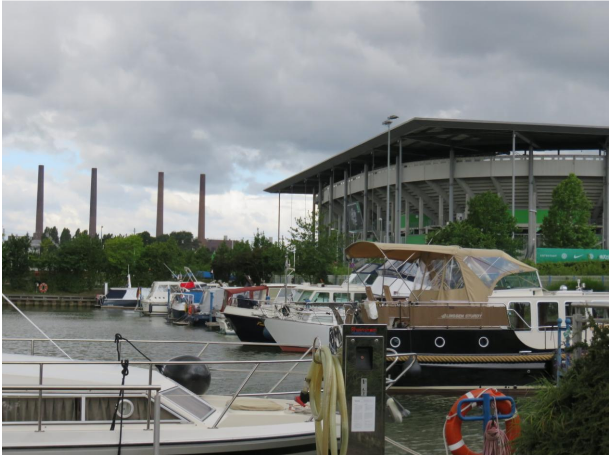
De haven ligt gelijk naast de VW Arena.

Na 5 uur rondlopen hebben we het nog niet allemaal gezien, maar houden we het wel voor gezien. We gaan aansluitend nog even per fiets de binnenstad in, maar dat is niet schokkend, weinig sfeervol, we zullen daar maar niet te veel woorden aan vuilmaken. We verwachten de komende weken mooiere steden/dorpen tegen te komen.