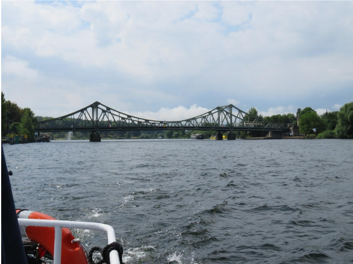
De Glienicker brücke