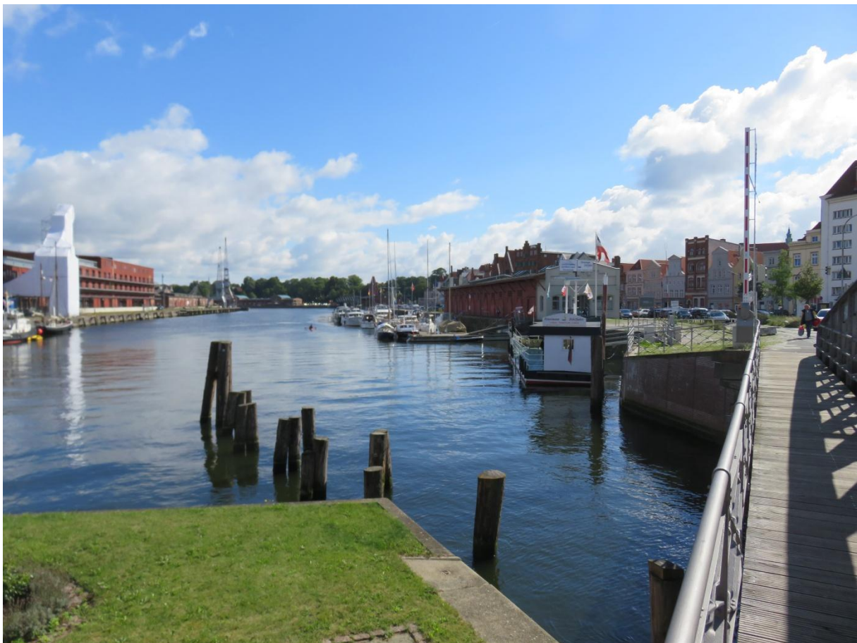
De hele week blijkt er in Lubeck het Duckstein festival te zijn (Biermerk) , eten, drinken, veel